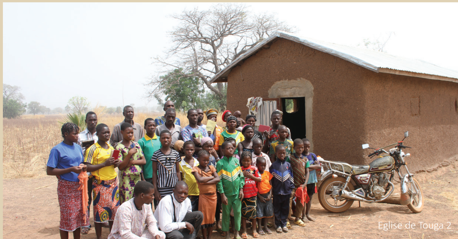
Eglise de Touga 2