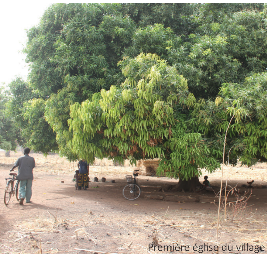
Première église du village