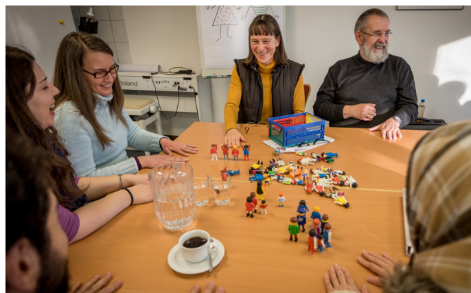
Lektion bei «Deutsch für Flüchtlinge»