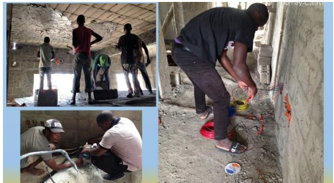
Artisans en train d'aménager la « Maison des langues maternelles » pour Wycliffe Bénin

« Nous rendons grâce au Seigneur pour tout ce qu'il fait, pour tous les partenaires qu'il suscite pour l'avancement de son œuvre à travers ce projet. Des groupes de prière sont constitués afin d'intercéder pour les travaux et les partenaires ! »