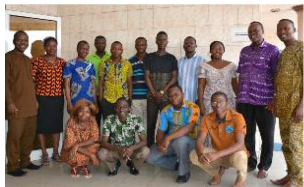
Collaborateurs de Wycliffe Bénin

Ces dernières années, plusieurs groupes de jeunes suisses ont rendu visite à Wycliffe Bénin pour faire meilleure connaissance de leur travail. En mars dernier, 6 participants de l'école Factory de Lausanne s'y sont rendus et ont fait leurs premières expériences en Afrique.